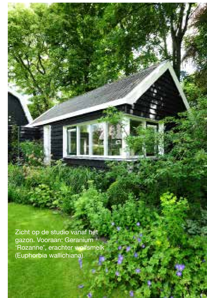
Zicht op de studio vanaf het gazon. Vooraan: Geranium 'Rozanne', erachter wolfsmelk ( Euphorbia wallichiana ).