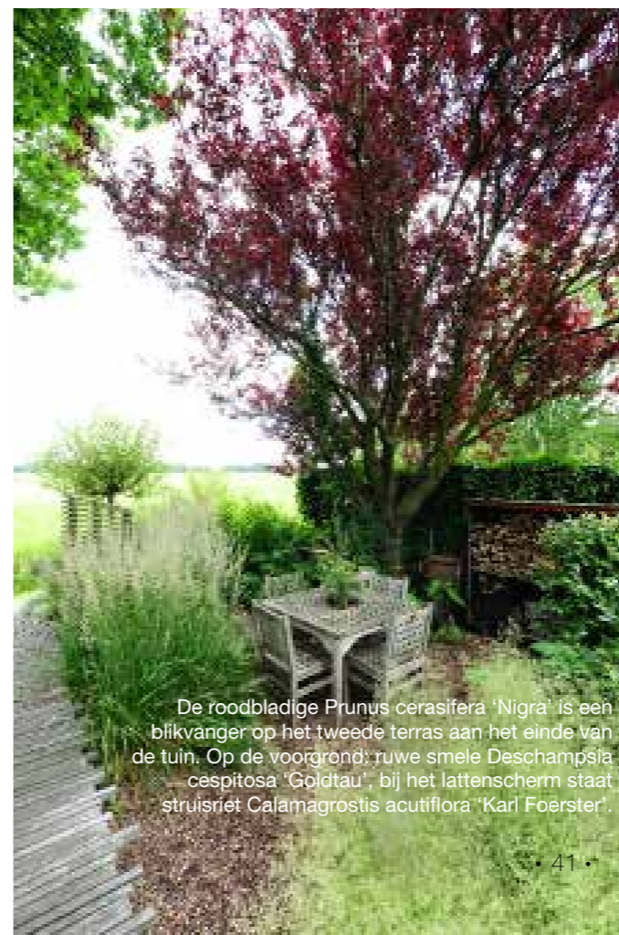
De roodbladige Prunus cerasifera 'Nigra' is een blikvanger op het tweede terras aan het einde van de tuin. Op de voorgrond: ruwe smele Deschampsia cespitosa 'Goldtau', bij het lattenscherm staat struisriet Calamagrostis acutiflora 'Karl Foerster'.