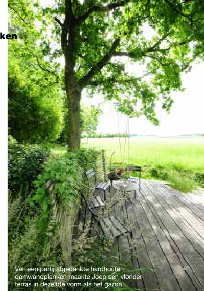
Van een partij afgedankte hardhouten damwandplanken maakte Joep een vlonderterras in dezelfde vorm als het gazon.