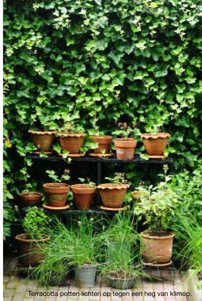
Terracotta potten lichten op tegen een heg van klimop.