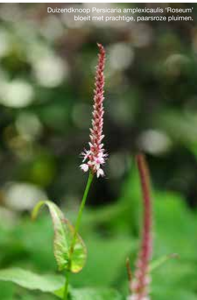
Duizendknoop Persicaria amplexicaulis 'Roseum' bloeit met prachtige, paarsroze pluimen.