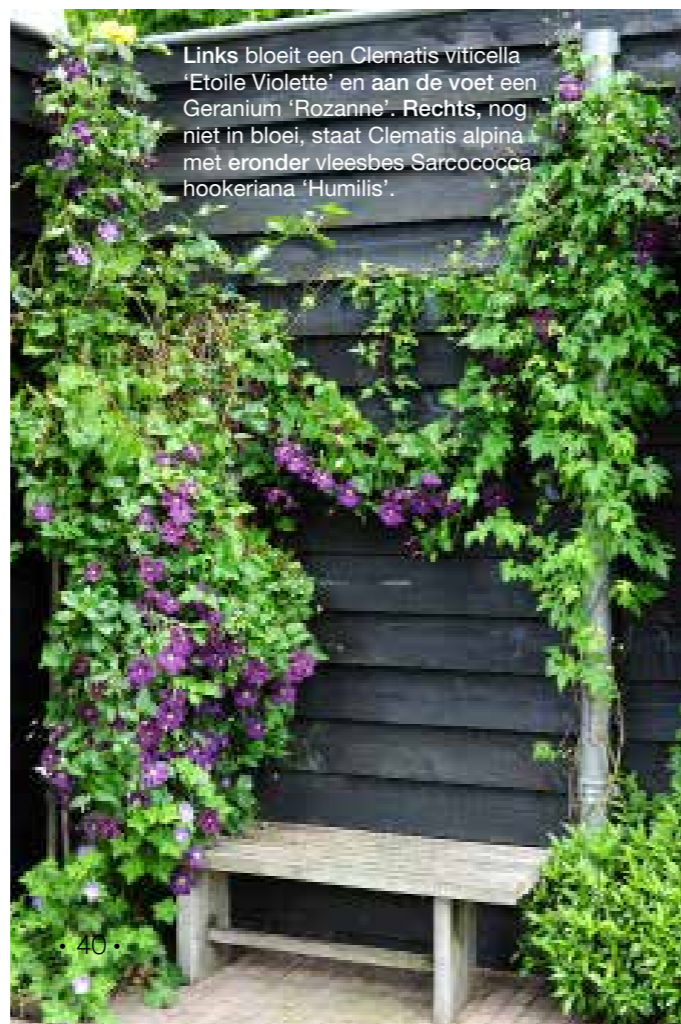
Links bloeit een Clematis viticella 'Etoile Violette' en aan de voet een Geranium 'Rozanne'. Rechts, nog niet in bloei, staat Clematis alpina met eronder vleesbes Sarcococca hookeriana 'Humilis'.